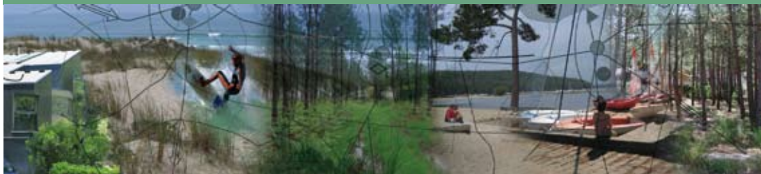
Schéma de Cohérence Territoriale des Lacs Médocains

Communauté de Communes des Lacs Médocains