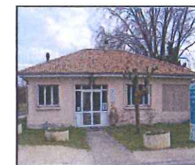
Lieu de la rédaction de « Parole de Jeune ».